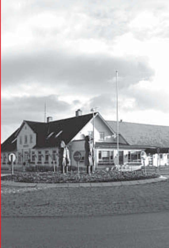
Hegnsyn på Rold Kro i oktober