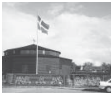
Cirkusmuseet er nabo til Rold Kro

En lørdag i oktober kom "Foreningen af Hegnsyn" til Rold og slog sig ned på Rold Gl. Kro. At kroen er nabo til et spændende cirkusmuseum smittede dog ikke af på programmet, der hverken bød på tryllekunstnere eller linedansere, men derimod på en god snak "over hækken" for de tilrejsende hegnsynsfolk.