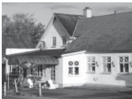
Rold Gl. Kro

Det var en strålende solskinsdag den lørdag, den 4. oktober, hvor hegnsynsforeningen havde lagt årets regionsmøde i det nordjyske, nærmere bestemt på Rold Gl. Kro. Trods de lokkende stråler og den blå himmel var de godt 30 forsamlede tilsyneladende godt tilfredse med at have afsat denne efterårsdag til at lytte, stille spørgsmål og fortælle om egne sager ud i den svære kunst at forlige stridende naboer.