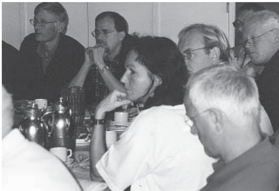
Forsamlingen lyttede intenst