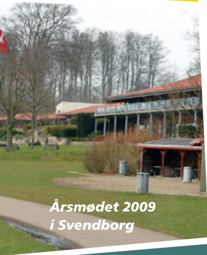
Årsmødet 2009 i Svendborg