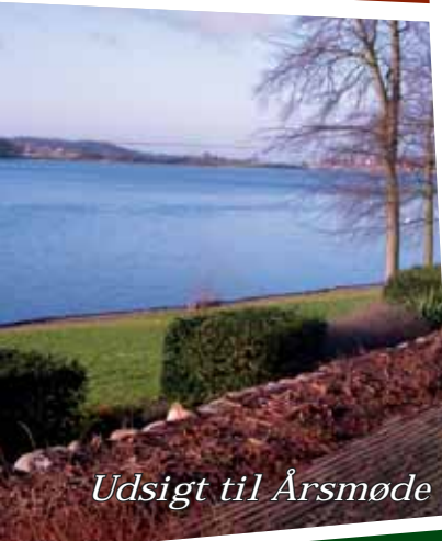
Udsigt til Årsmøde