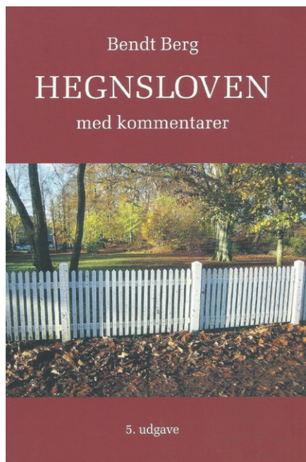
Forsiden af bogen.

Godt at se, at denne -- ganske skelsættende -- højesteretsdom -- om god tro ved hævde / den rådendes subjektive forhold har fundet plads i bogen, hvor redaktionen ellers er som udgangspunkt nævnes