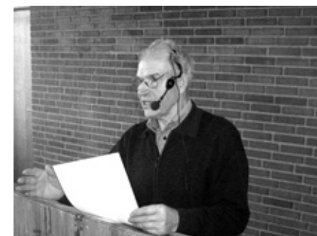
Billeder fra efterårsmøde på Vissenbjerg Storkro d. 30. oktober, hvor livlig debat og flot fremmøde satte fokus på vigtigheden af Hegnsynenes arbejde.