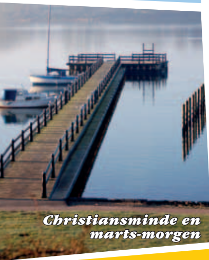
Christiansminde en marts-morgen