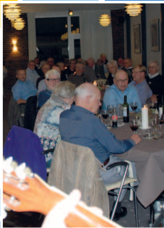
Næste årsmøde står i jubilæumstegn.