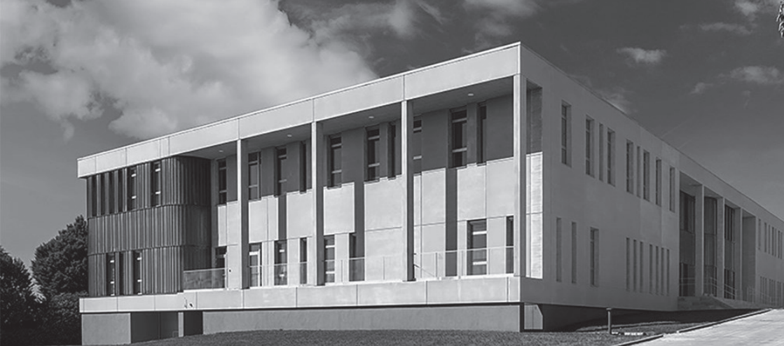
Retten i Svendborg